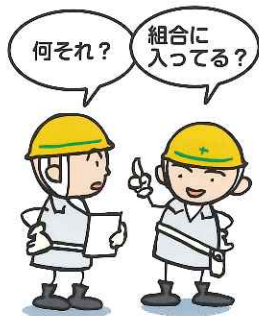
組合本部 (兵庫土建会館)