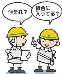
組合本部 (兵庫土建会館)